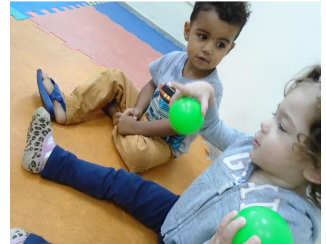
Brincadeira passando bolinhas coloridas (identificação e preferência da cor)