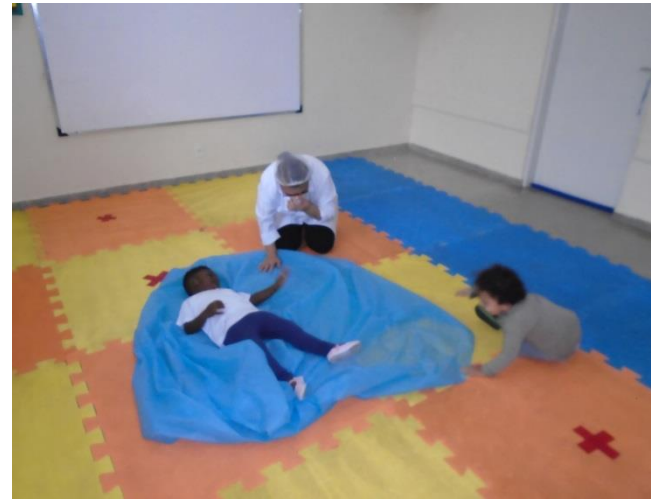
Brincadeira pano encantado – estimulando a coordenação