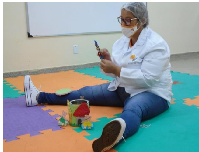
Contação de história na lata