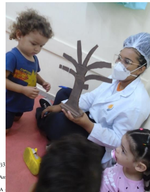
História: Árvore sem folhas