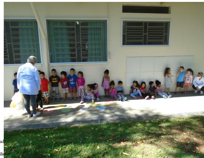
Brincadeira de circuito na área externa