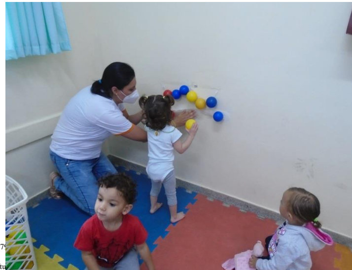
Brincadeira – Teia de aranha com bolinhas