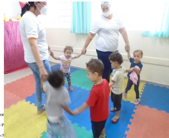
Cantigas de roda