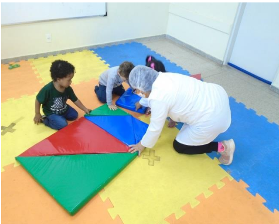
Atividade com tangram gigante