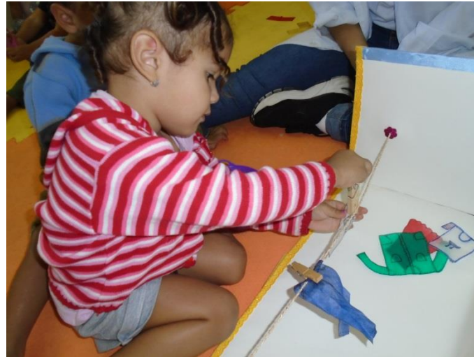
Brincadeira – Varal das cores