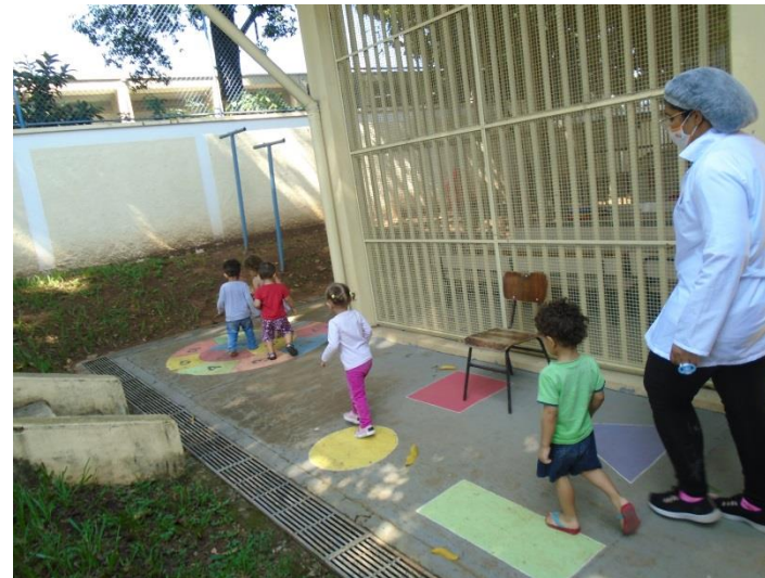
Escolha de brincadeiras na área externa