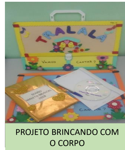
PROJETO BRINCANDO COM O CORPO