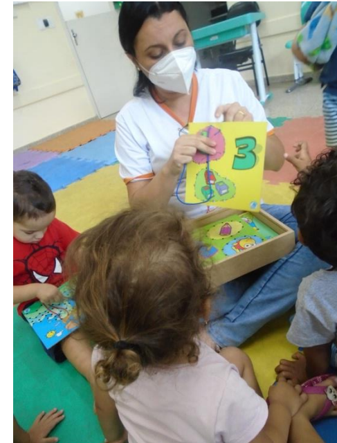
Atividade com alinhavo