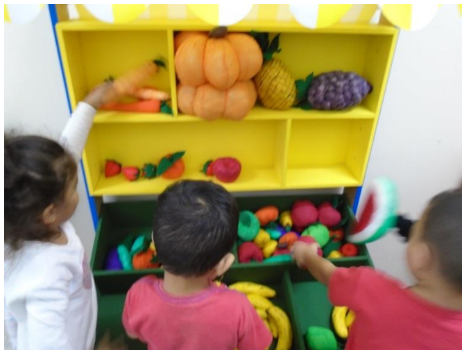
Brincadeira – Indo a feira (escolha de alimentos saudáveis)