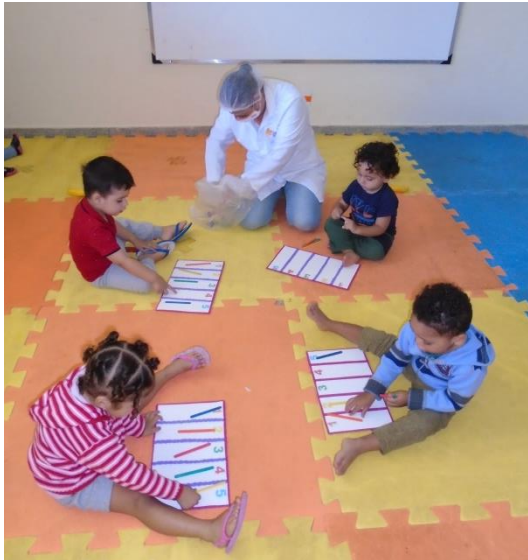
Atividade com sequência de cores