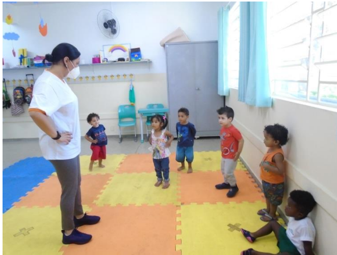
Brincadeira musical – Partes do corpo