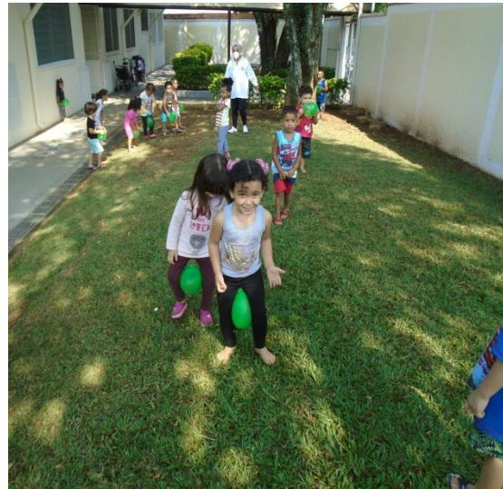
Brincadeira com bexigas entre as pernas