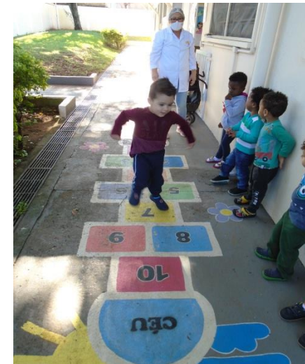
Brincadeira de amarelinha

Sede: Rua Guarin João Badin, 36 – Jardim Morada do Sol – (19)3816-1637