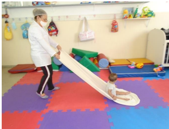
Brincadeira de estímulo sensorial com tecido