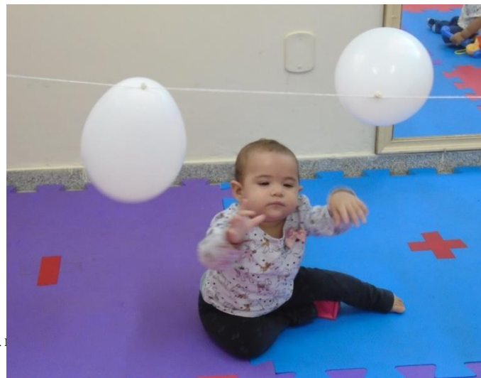
Atividade com berçário - Varal de bexigas