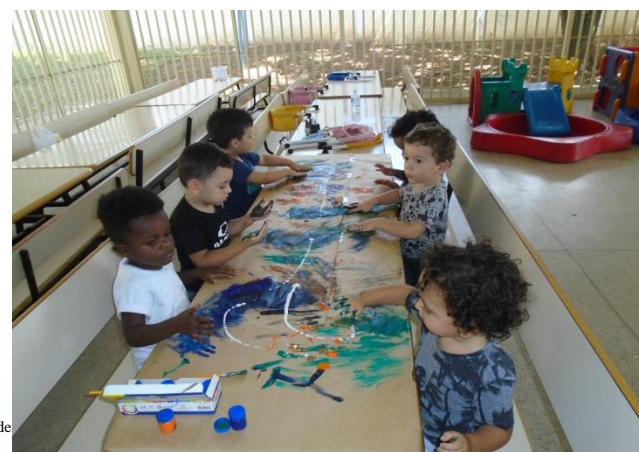
Pintura no papel craft