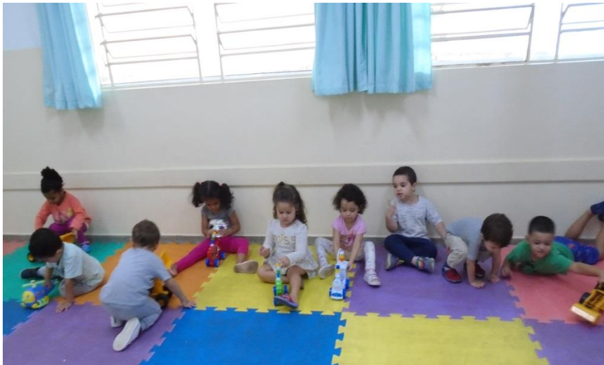
Brincadeira em sala -Escolha de brinquedos