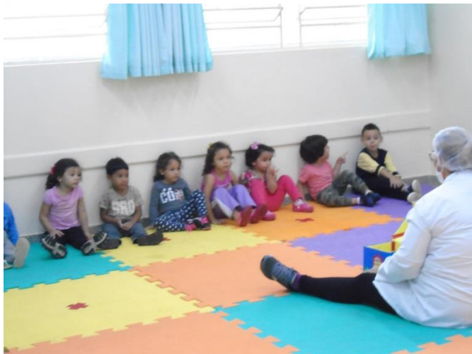
Poema: A casa e o seu dono